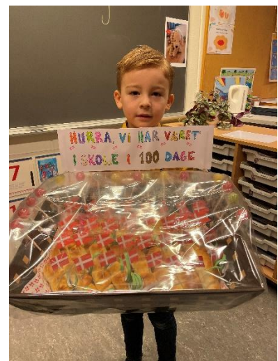
100 dages fest i børnehaveklassen.

I ældstegruppen har vi er der pt. et projekt, der hedder "Farver og Følelser". Projektet handler om at forstå følelser og hvad følelser gør ved os, samt at ingen følelser er rigtige eller forkerte. Personalet øver sig sammen med børn og en