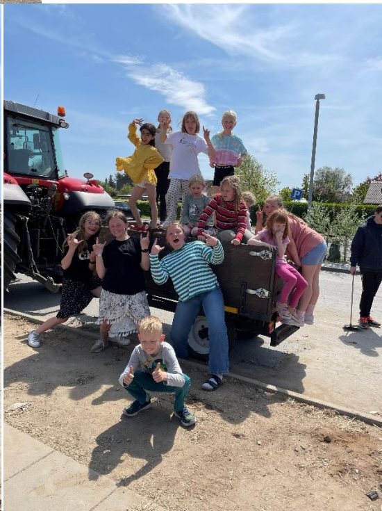
Koncert fra musikskolen.